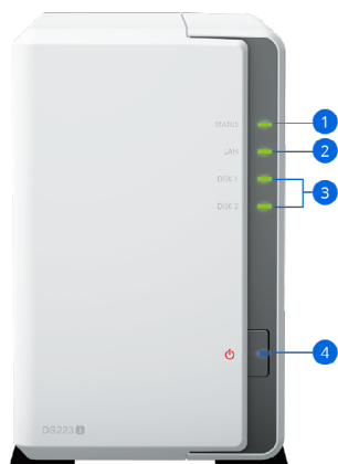
DS223j (передняя панель)